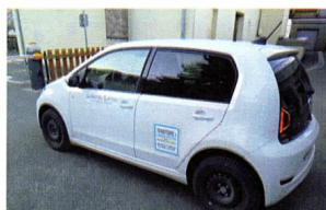
Un des véhicules électriques achetés

Le montant de ces travaux s'élève à 1 230 €TTC (1 025 €HT). La ZOÉ a été achetée via la plateforme UGAP pour un montant total de 25 761.93 €HT, dont 6 964.90 €HT de batterie (ou 30 913.76 €TTC au total). Le second véhicule a été acheté après mise en concurrence d'une petite citadine à la concession Volkswagen de Gap pour un montant de 20 573.30 €HT (ou 24 682.60 €TTC).