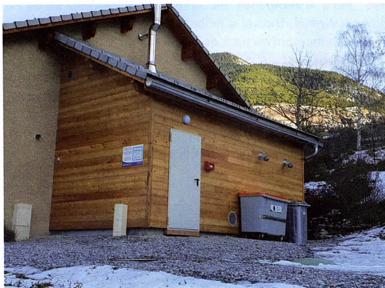
Chaufferie bois de la gendarmerie

Coût des travaux : 113 333 € HT TEPCV : 80 000 € Autofinancement : 33 333 €