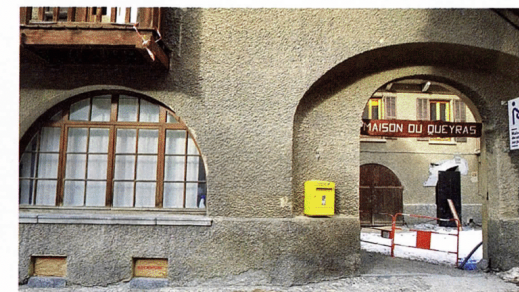
Entrée de la Maison du Bourbonnais, qui accueille maison de services au public, agence postale et bureau d'information touristique

Un territoire à énergie positive pour la croissance verte (TEPCV) est un territoire d'excellence de la transition énergétique et écologique. La collectivité s'engage à réduire les besoins en énergie de ses habitants, des constructions, des activités économiques, des transports, des loisirs. Elle propose un programme global pour un nouveau modèle de développement, plus sobre et plus économe.