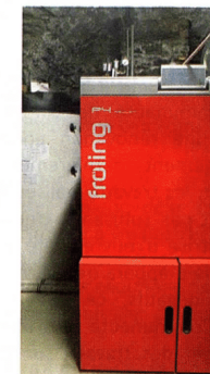
La chaudière installée

accessibilité sont également en cours et doivent s'achever pour la fin d'année permettant ainsi la tenue de cours individuels et collectifs de l'école de musique à l'ensemble des personnes y compris celles en situation de handicaps. Enfin, les travaux s'achèveront au printemps 2019 avec le transfert de l'agence postale et du bureau d'information touristique sein d'un local unique dédié pour ces accueils.