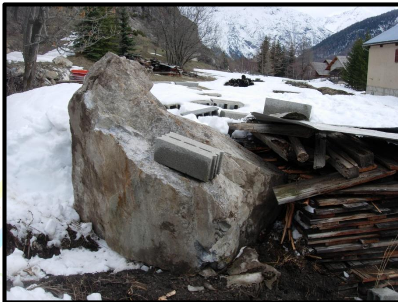
Chute de blocs, Névache

Les mouvements rapides et discontinus sont quant à eux caractérisés par leur brutalité d'apparition. On distingue les effondrements de cavités souterraines, les glissements de terrain par rupture de versant instable, les coulées boueuses et les éboulements de falaise et les chutes de blocs.